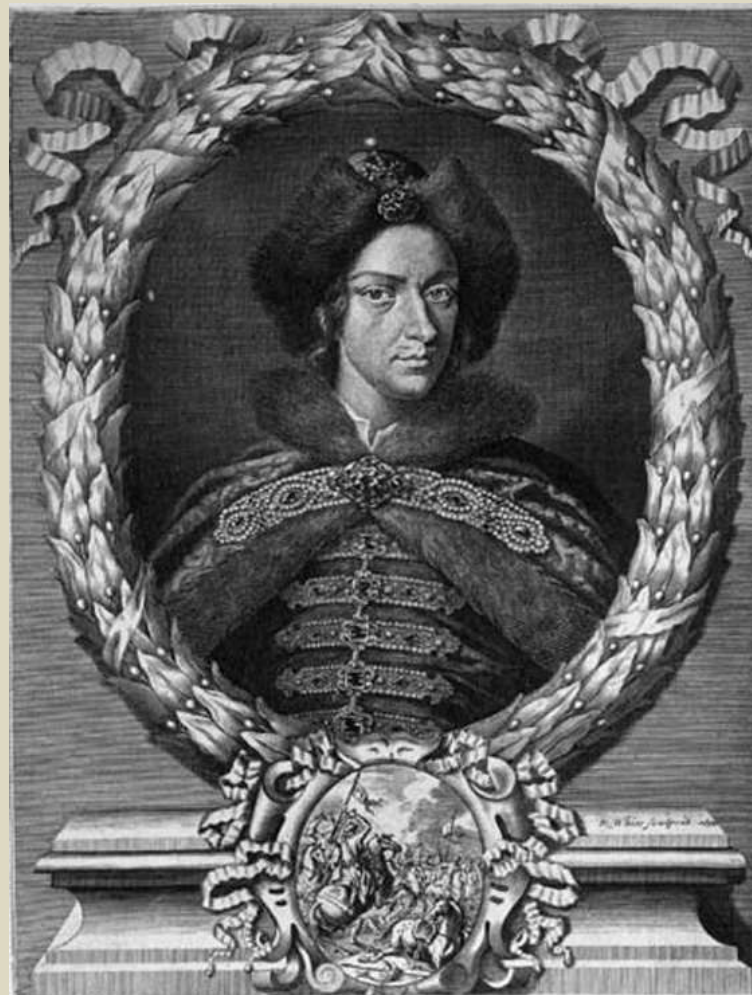
The Grand CZAR of Moscow.