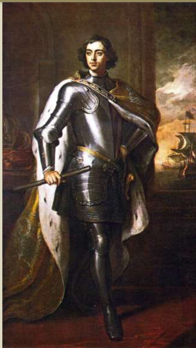
Готфрид Кнеллер. «Портрет Петра I». 1698.