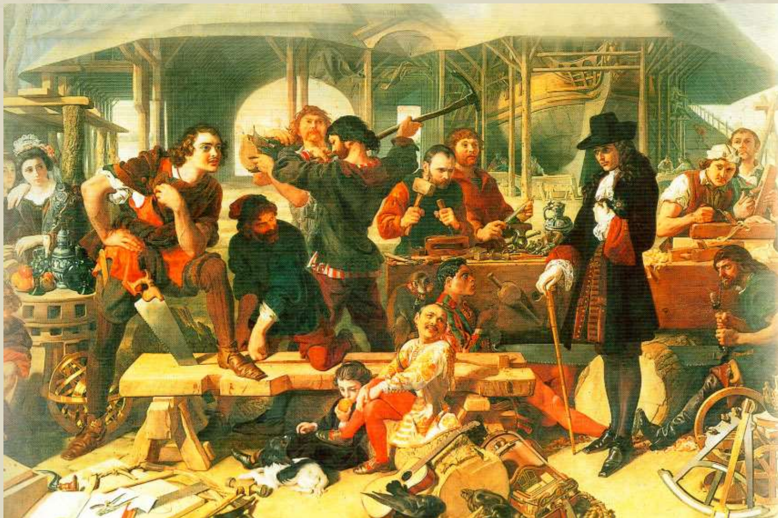
Даниел Маклиз. «Пётр I в Дептфорде в 1698 году».