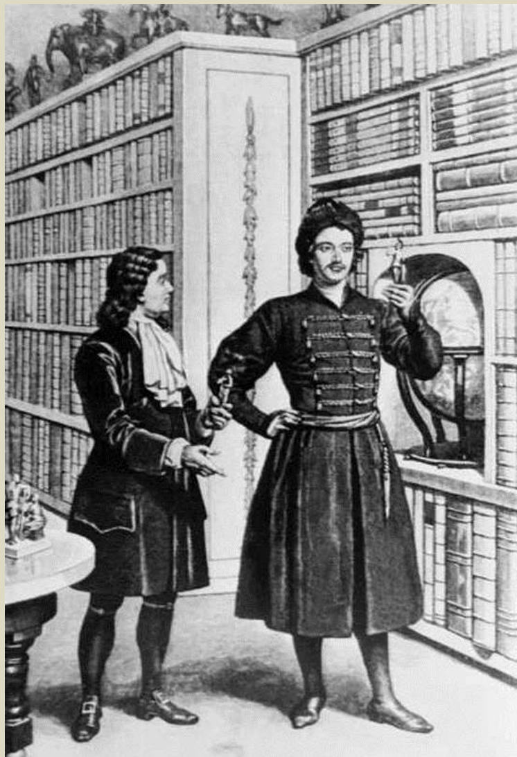
Николай Дмитриевич Дмитриев-Оренбургский. «Пётр I в кабинете голландского собирателя редкостей Якова-де-Вильде».