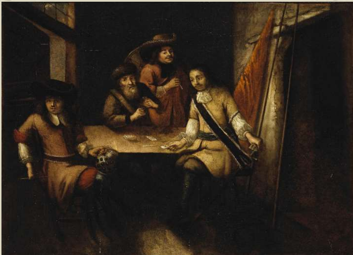
Неизвестный голландский художник. «Беседа Петра I в Голландии». 1690-е.