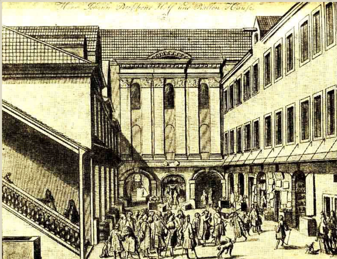
Питер Шенк. «Пётр I осматривает редкости в Лейпциге 31 мая 1698».