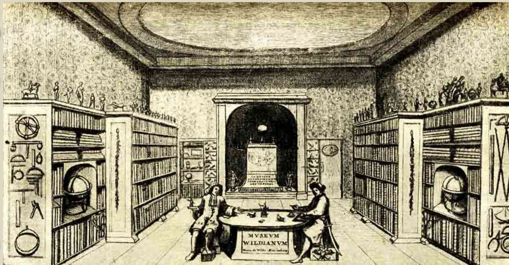
М. Вильде. «Пётр I в музее редкостей Вильде в Амстердаме. 13 декабря 1698.»