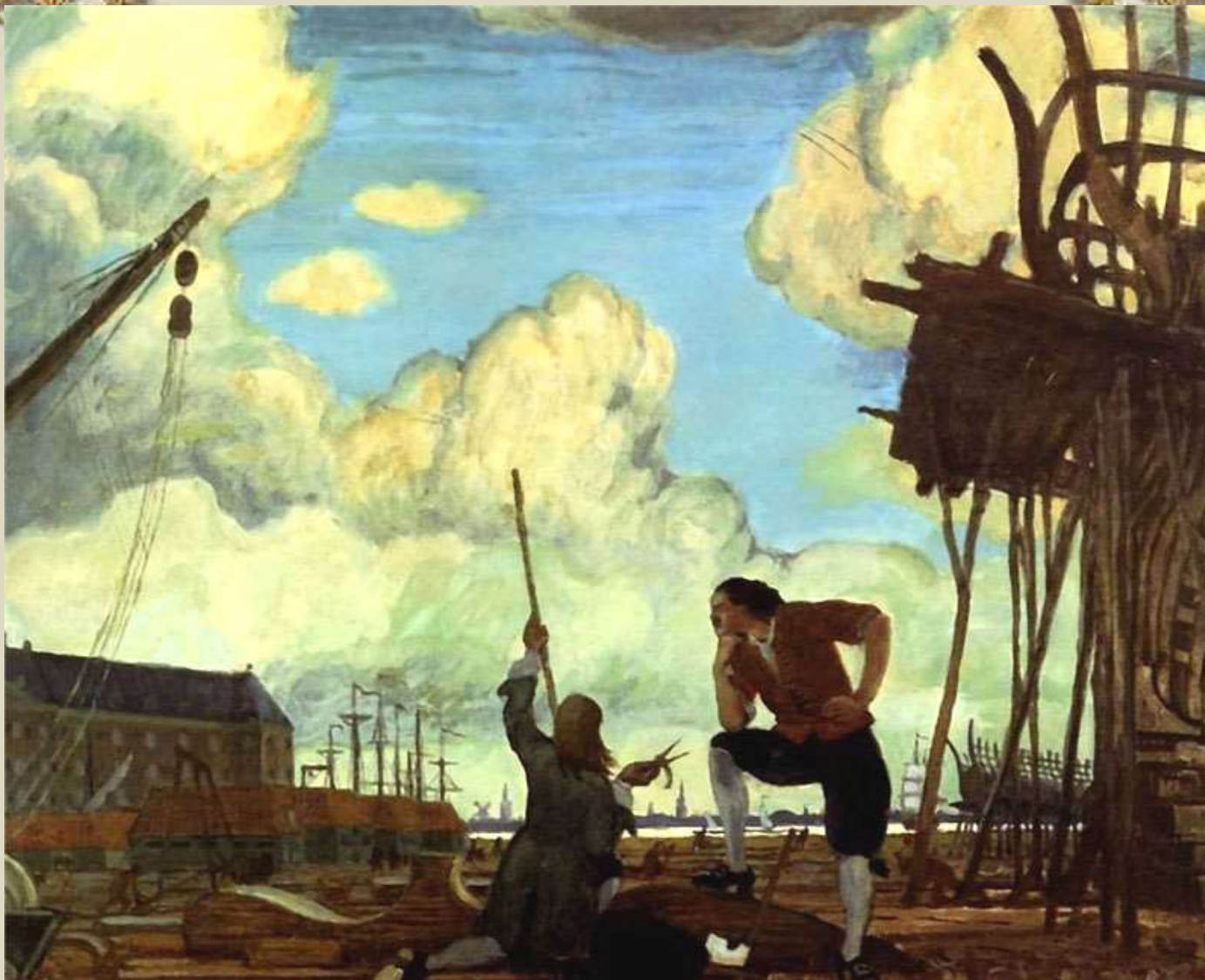
М. Добужинский. «Пётр Великий в Голландии. Амстердам, верфи Ост-Индской Компании».