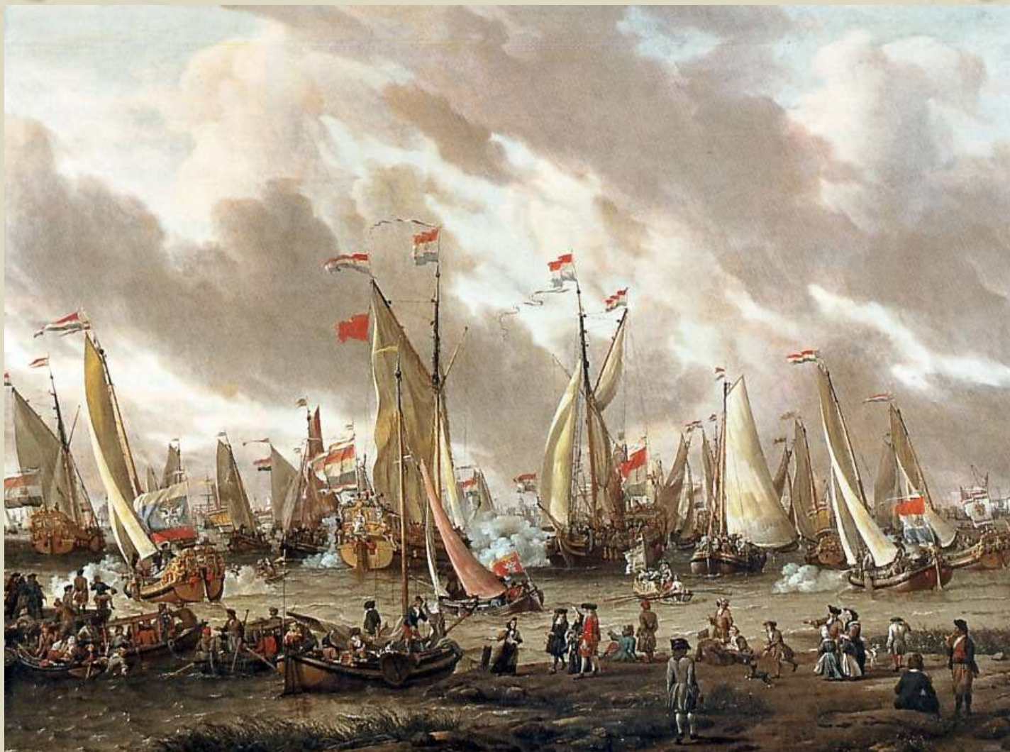
Абрахам Шторк. «Посещение Петром I Голландии. Показательный бой на реке Эй в честь Петра I 1 сентября 1697 года».