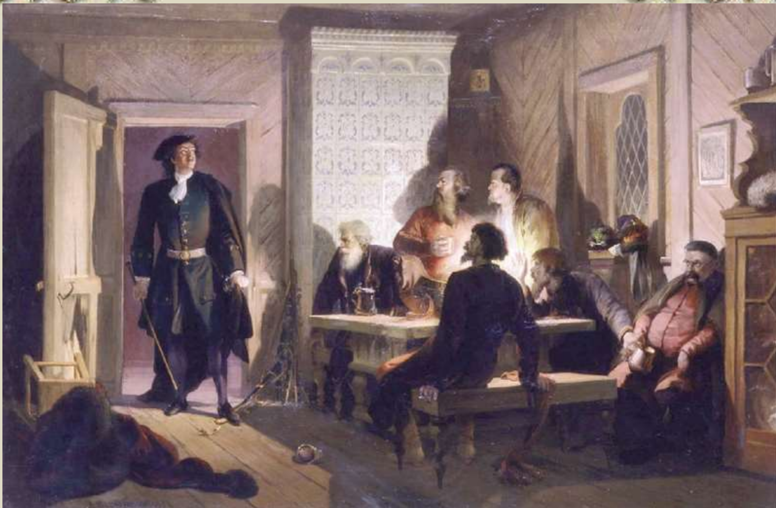
Адо́льф Ио́сифович Шарлемань. «Пётр I накрывает заговорщиков в доме Циклера 23 февраля 1697 года». 1884.