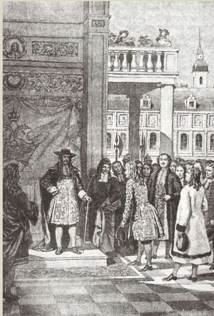
«Пётр Великий в Вене у императора Леопольда в 1698 году».