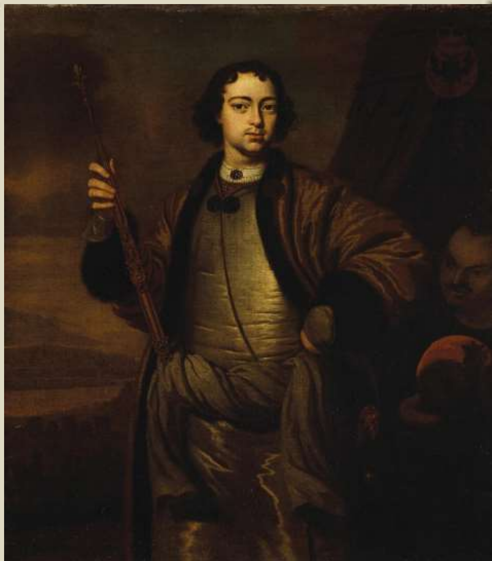
Питер ван дер Верф, приписывается. «Портрет Петра I». 1690-е.