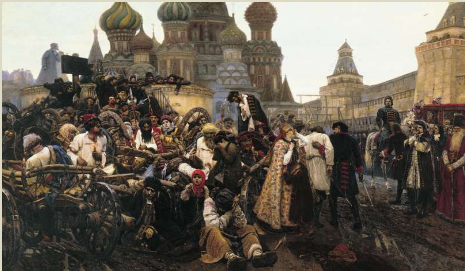
В. Суриков. «Утро стрелецкой казни». 1881.