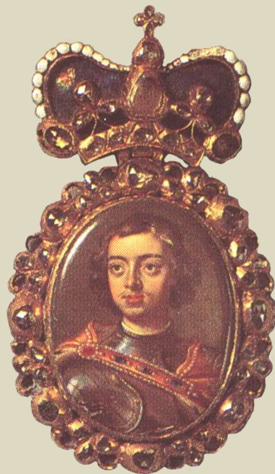
Наградной портрет Петра Великого. Миниатюра.