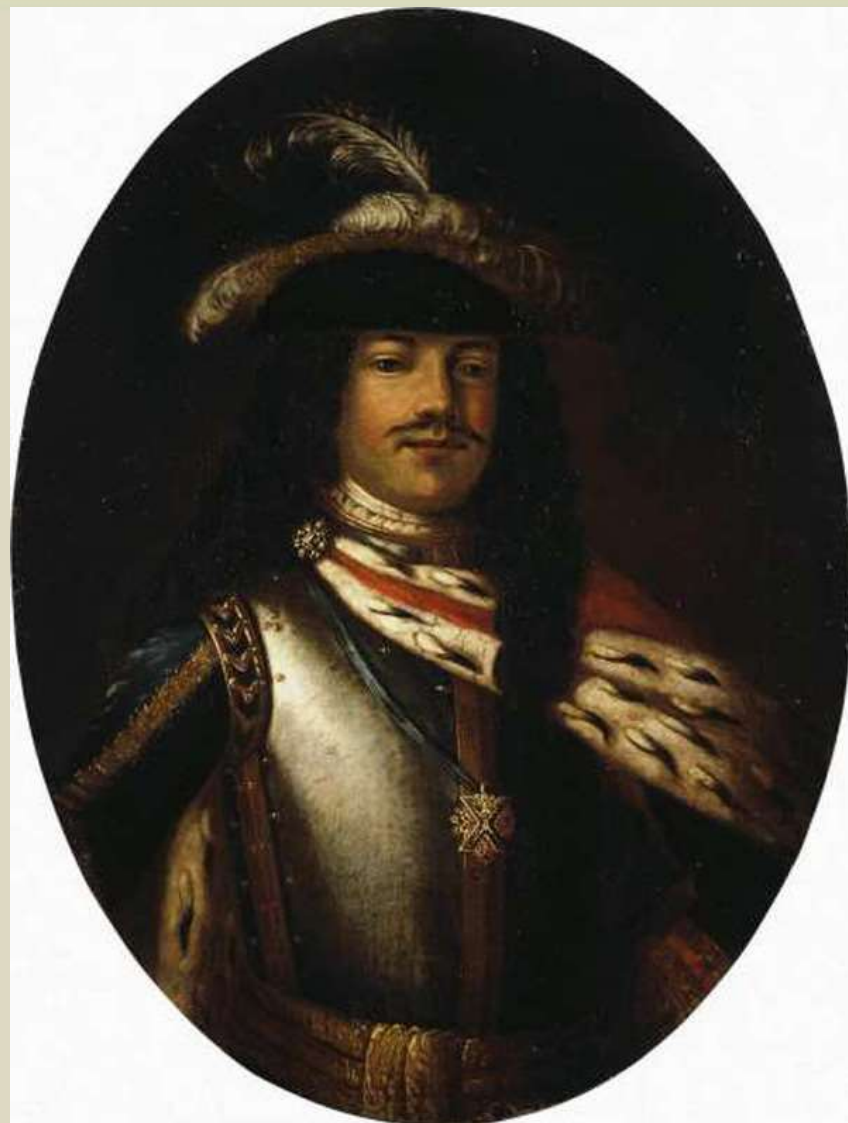
Неизвестный художник. «Портрет Петра I».