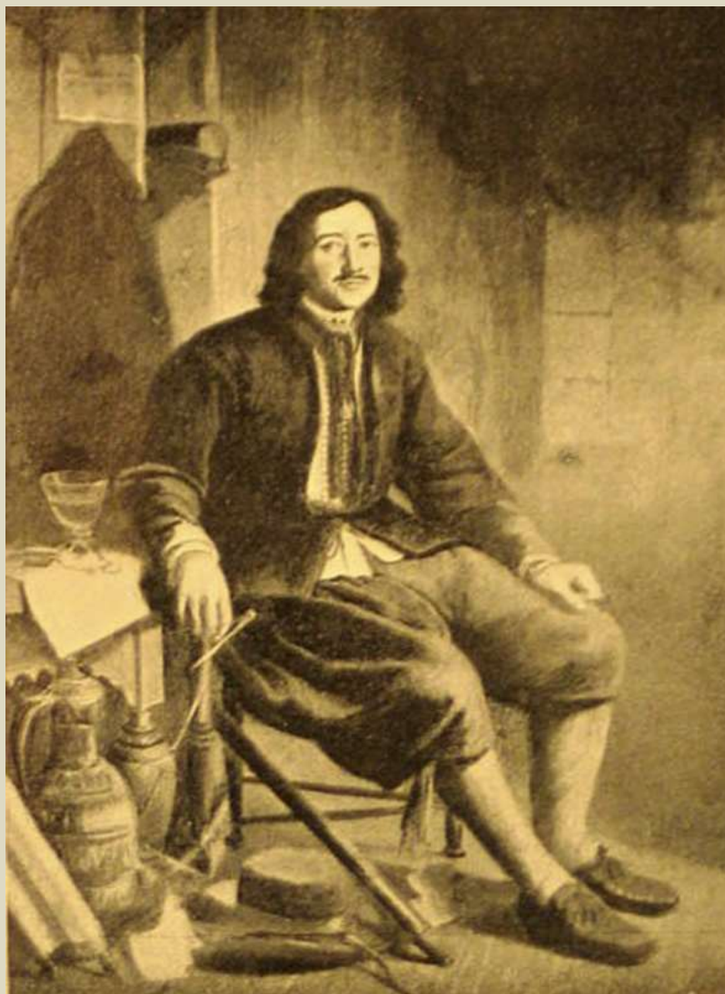
«Пётр I в costume корабельного мастера». Иллюстрация из книги «Домик Петра I в Заандаме».