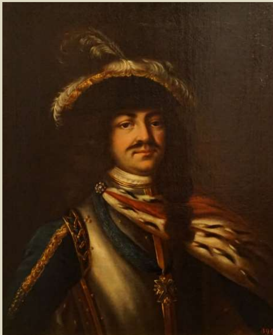
Неизвестный художник. «Портрет Петра I». Первая половина XIX века.