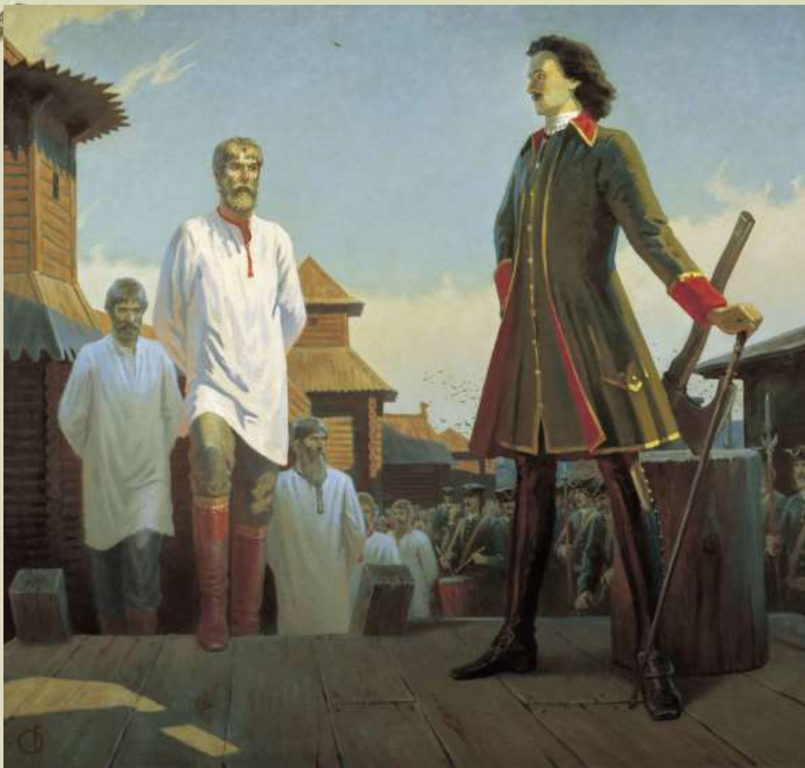
Б. Ольшанский. «Посторонись, государь, это моё место». 1998.