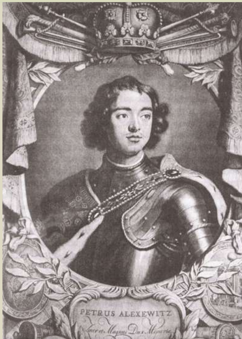
П. Гунст. «Пётр I».