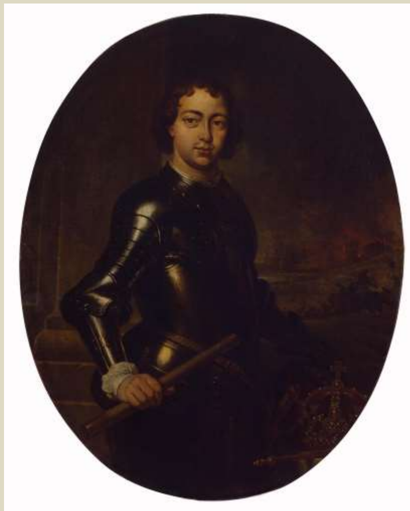
Ян Веникс. «Портрет Петра I». 1697(?)