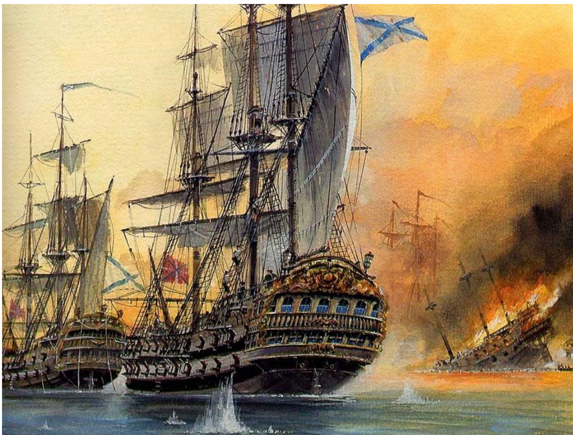
Корабли петровских времен

Традиции оставлять трофейные корабли под прежними именами про держались в военном флоте довольно долго: достаточно вспомнить те, которые плавали и воевали под русским флагом «Бриллиант» (год пленения корабля — 1734-й), «Родос» (1770), «Принц Густав» (1786), «Венус» (1789), «Ретвизан» (1790), «Сед-ель-Бахр» (1807), «Фалк» (1808), «Эмгейтен» (1808) и другие.