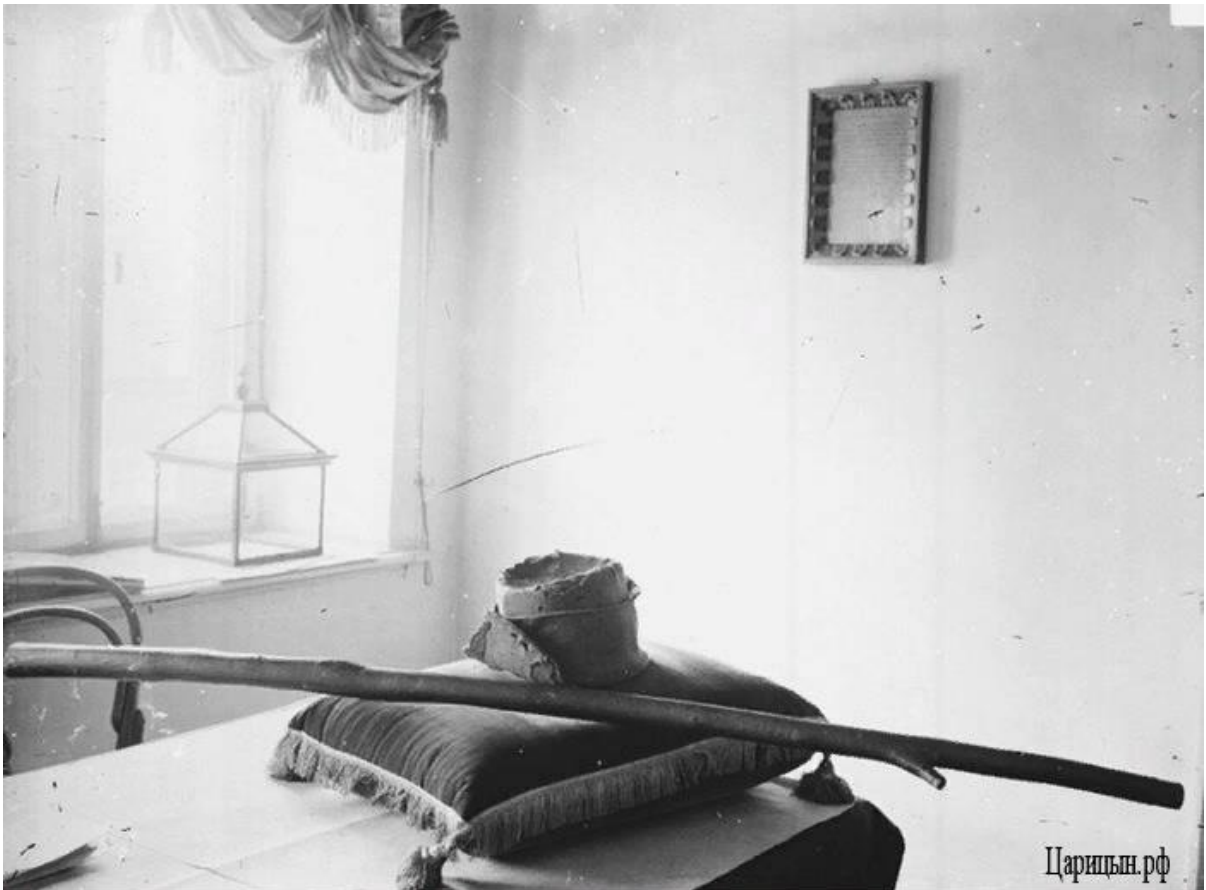
Трость и картуз подаренные Петром I жителям Царицына.

Пожалуйста, совершите виртуальную экскурсию по Волгоградскому областному краеведческому музею.