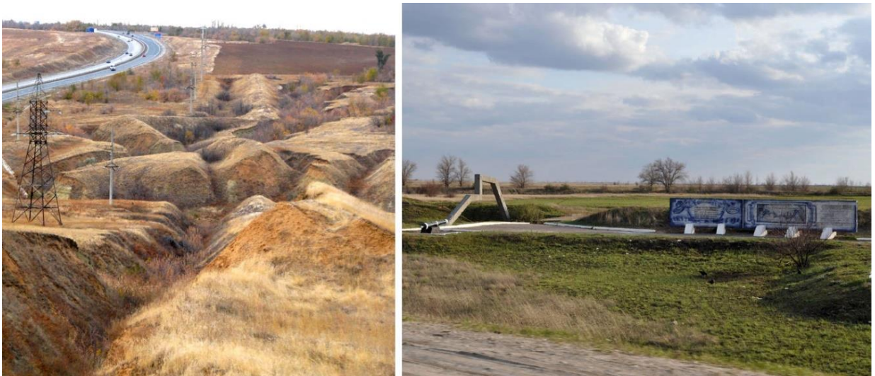
Остатки Царицынской сторожевой линии и мемориальный комплекс «Петров вал»

С именем Петра I связана и Царицынская сторожевая линия — возведенная по царскому указу против набегов крымских татар и протянувшаяся на 60 верст от Царицына к казачьему городку на Дону Паншину — она состояла из непрерывного вала высотой 12 метров с деревянным палисадом, 25 форпостов и 5 крепостей, самой крайней из которых с волжского берега был Царицын.