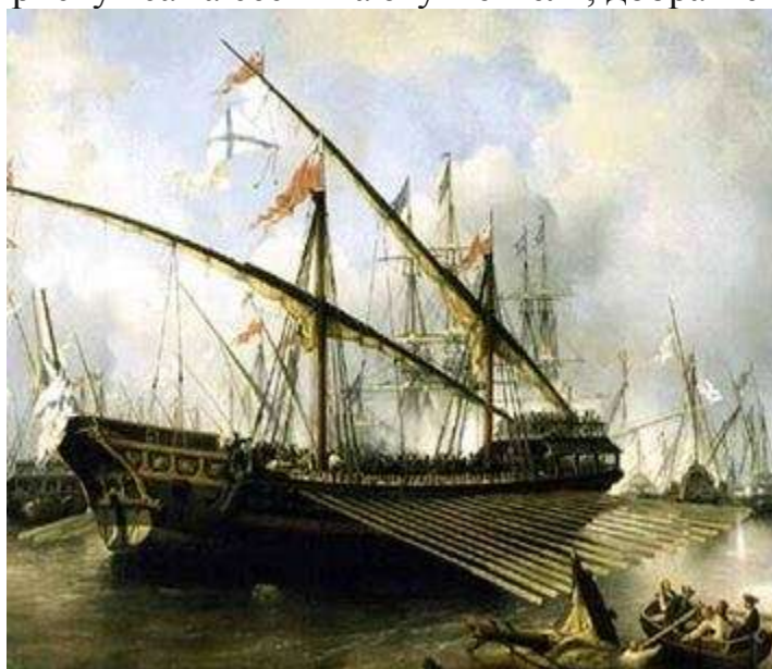
Сражение у о-ва Гренгам , 7 августа 1720 года

Тут-то, близ Лахты, в темный, сильно ветренный поздний вечер с царской яхты заметили бот с солдатами и матросами, который сел на мель. Петр тотчас велел идти к боту, чтобы снять его с мели. Но это намерение оказалось неосуществимым – яхта имела очень глубокую осадку и не могла, не рискуя сама сесть на эту же мель, добраться до бота.