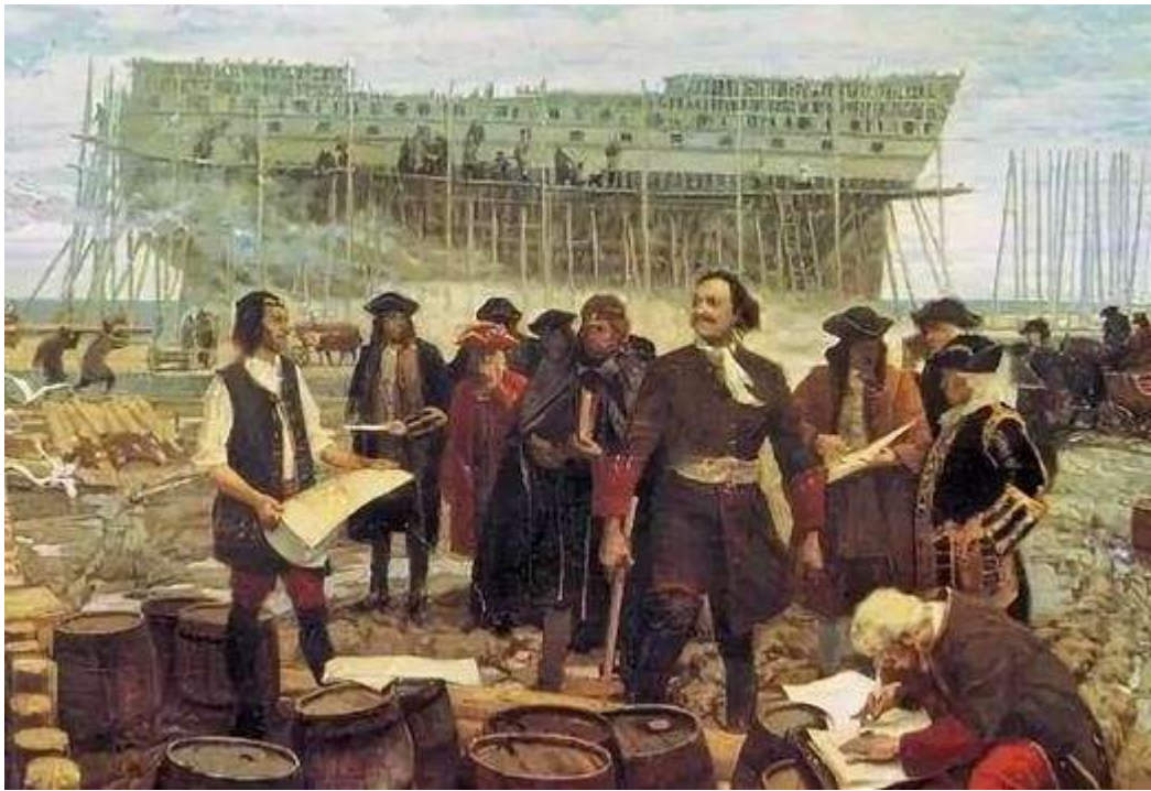
Корабелы Петра Первого