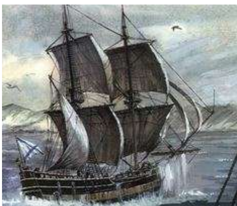
24-пушечный корабль «Святой апостол Павел»

В марте 1697 года посольство выехало из Москвы. В нем числилось более 250 персон, среди них 35 волонтеров, в том числе и урядник преображенского полка Петр Михайлов- царь Петр Алексеевич, решивший ехать инкогнито.