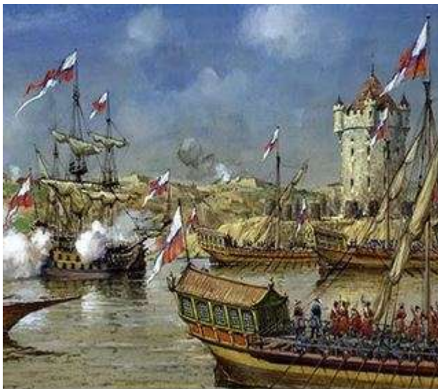
Русские корабли блокируют турецкую крепость Азов

Юный Петр Алексеевич, питавший страстную любовь к морю, от близких к нему образованных иностранцев, его наставников и собеседников, особенно же от голландца Тимермана и швейцарца Лефорта, приобрел первые понятия о морской науке и сознание важности флота для России. Случайно же найденный им в 1688 году старый английский ботик, принадлежавший деду Петра Никите Ивановичу Романову, познакомил царя с удовольствием плавания под парусами.