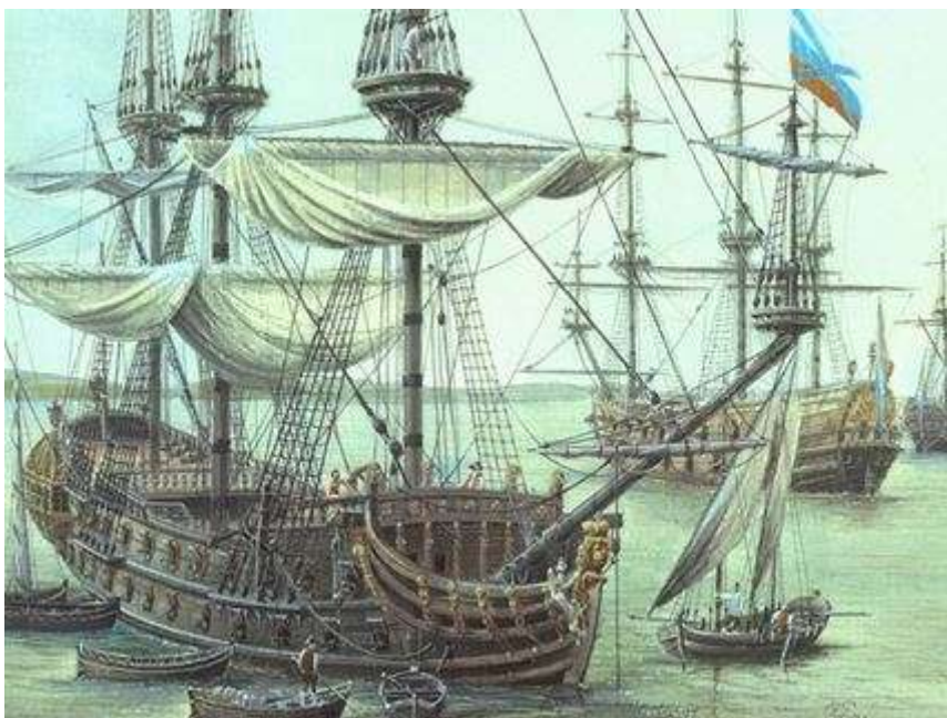
Парусный корабль «Крепость»

Тут-то, близ Лахты, в темный, сильно ветренный поздний вечер с царской яхты заметили бот с солдатами и матросами, который сел на мель. Петр тотчас велел идти к боту, чтобы снять его с мели. Но это намерение оказалось неосуществимым – яхта имела очень глубокую осадку и не могла, не рискуя сама сесть на эту же мель, добраться до бота.