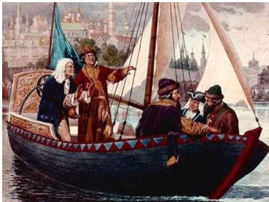
Ботик Петра Первого

В ходе показательных сражений на суше и маневров "флота" на воде, выковывались кадры солдат и матросов, офицеров, генералов и адмиралов, отрабатывались боевые навыки. На Переяславском озере, построили два фрегата, три яхты, сам Петр на Москве-реке сооружал небольшие гребные суда. В конце лета 1691 года появившись на Переяславском озере, царь заложил первый русский военный корабль. Строить его должен был Ромодановский, ставший волей царя адмиралом. Петр сам с охотой участвовал в строительстве. Корабль соорудили, спустили на воду. Но размеры озера не давали необходимого простора для маневров.