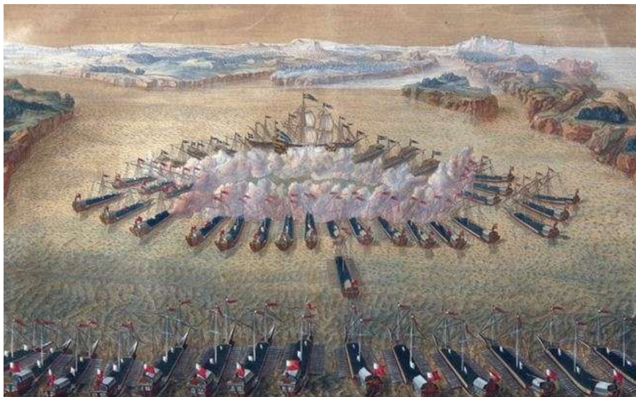
Гагустское сражение, 9августа 1714 года

Швеции. В этом заключалась единственная возможность принудить Швецию к заключению мира.