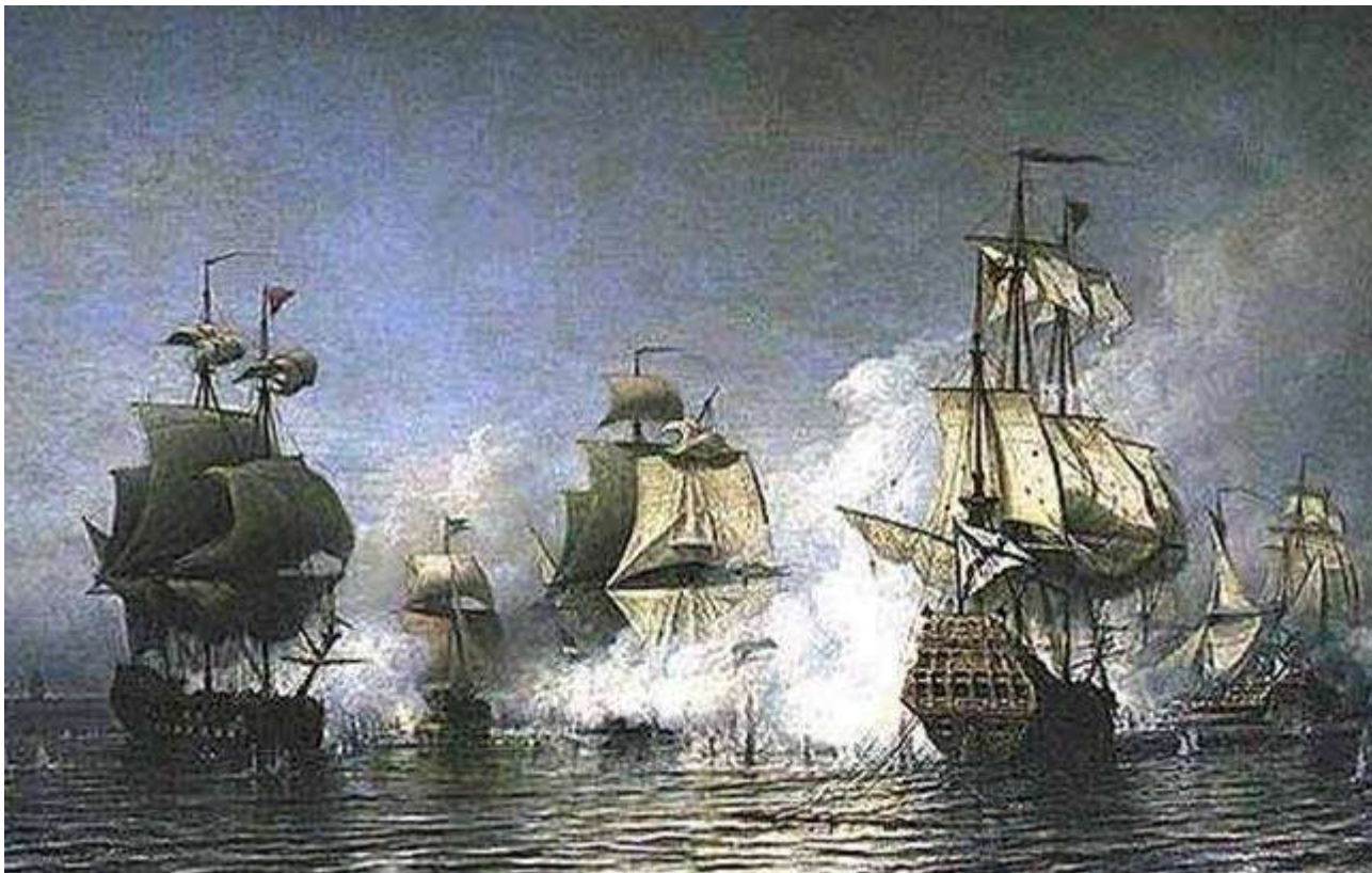
Сражение у о-ва Эзель, 4 июня 1719 года

30 августа 1721 г. Швеция согласилась, наконец, подписать не штатский мирный договор. К России отходила восточная часть Финского залива, его южный берег с Рижским заливом и прилегающими к завоеванным берегам островами. В состав России вошли города Выборг, Нарва, Ревель, Рига. Подчеркивая значения флота в Северной войне, Петр I приказал выбить на медали, утвержденной в честь победы над Швецией, слова: "Конец сей